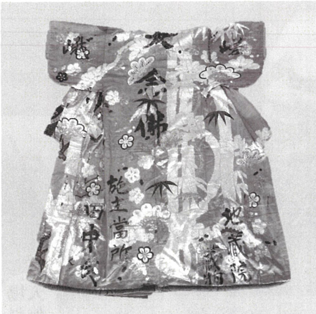
田中氏奉納装束(嵯峨大念佛狂言保存会所蔵)

京都産業大学ギャラリーでは2016年に開催した「第11回企画展 嵯峨大念佛狂言展」以降も継続して取材を行ってきました。旧狂言堂で行われた最終公演の映像や、狂言堂修復中の様子なども併せて紹介します。