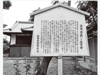
嵯峨狂言堂前に建つ謡曲史跡保存会の駒札